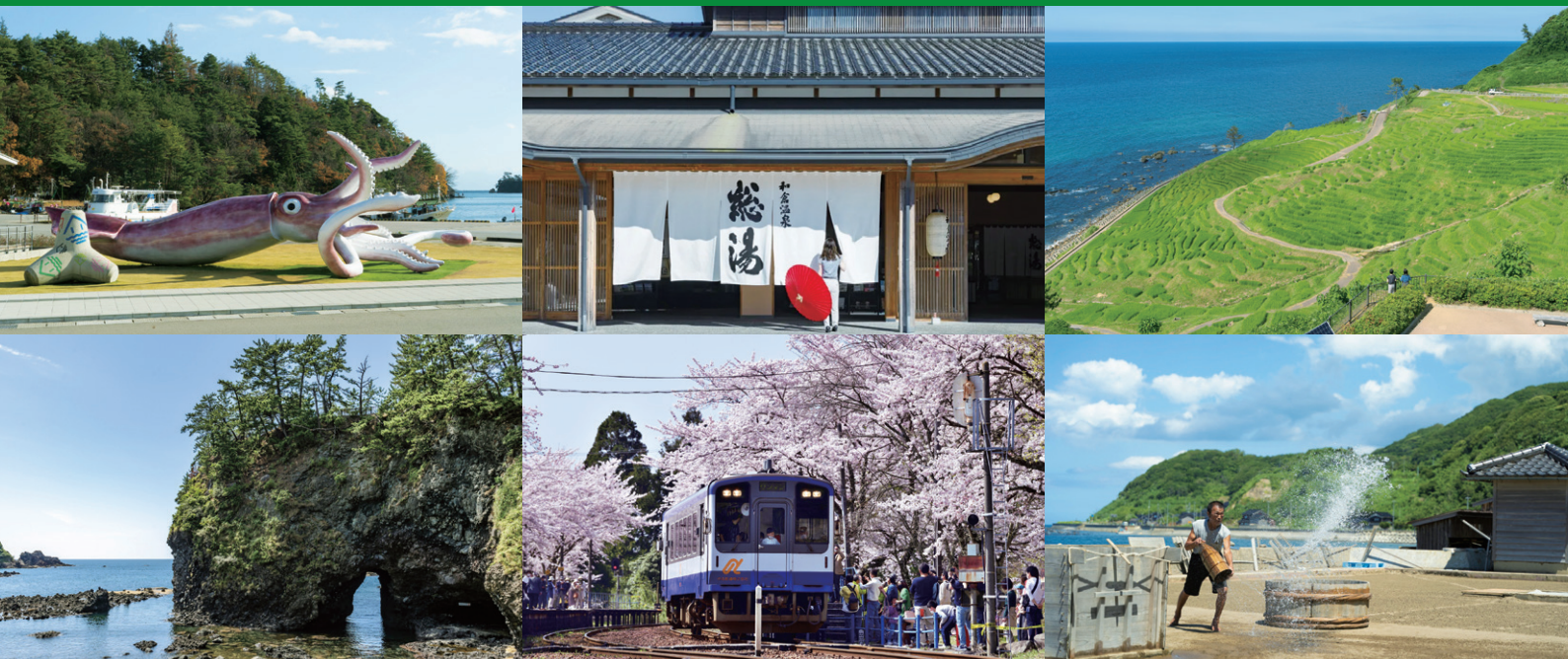
上部左：イカの駅つくモール(能登町) 上部中央：和倉温泉総湯(七尾市) 上部右：白米千枚田(輪島市) 下部左：巖門(志賀町) 下部中央：能登さくら駅(穴水町) 下部右：揚げ浜塩田(珠洲市)