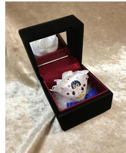
ヤクルトスワローズ 14