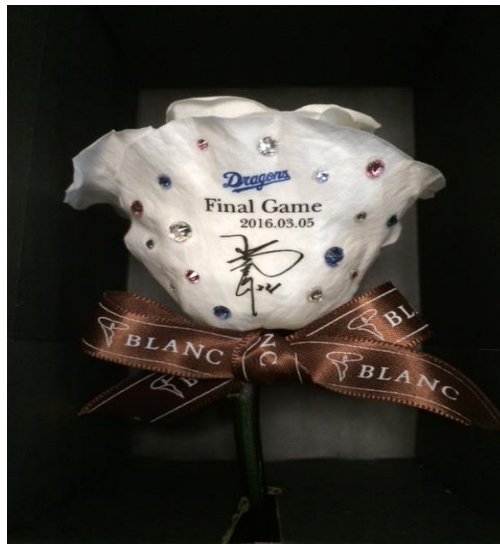
Copyright © Blanc since 2017 All Rights Reserved.