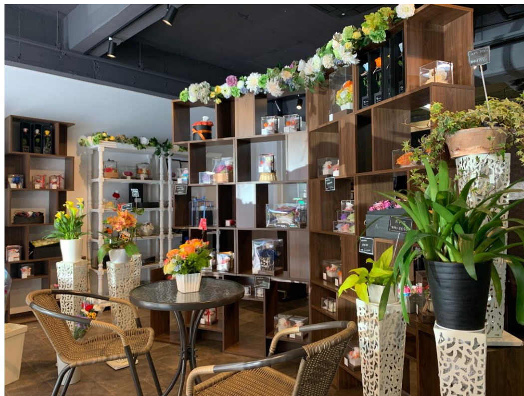
神奈川支店（川崎市多摩区生田）