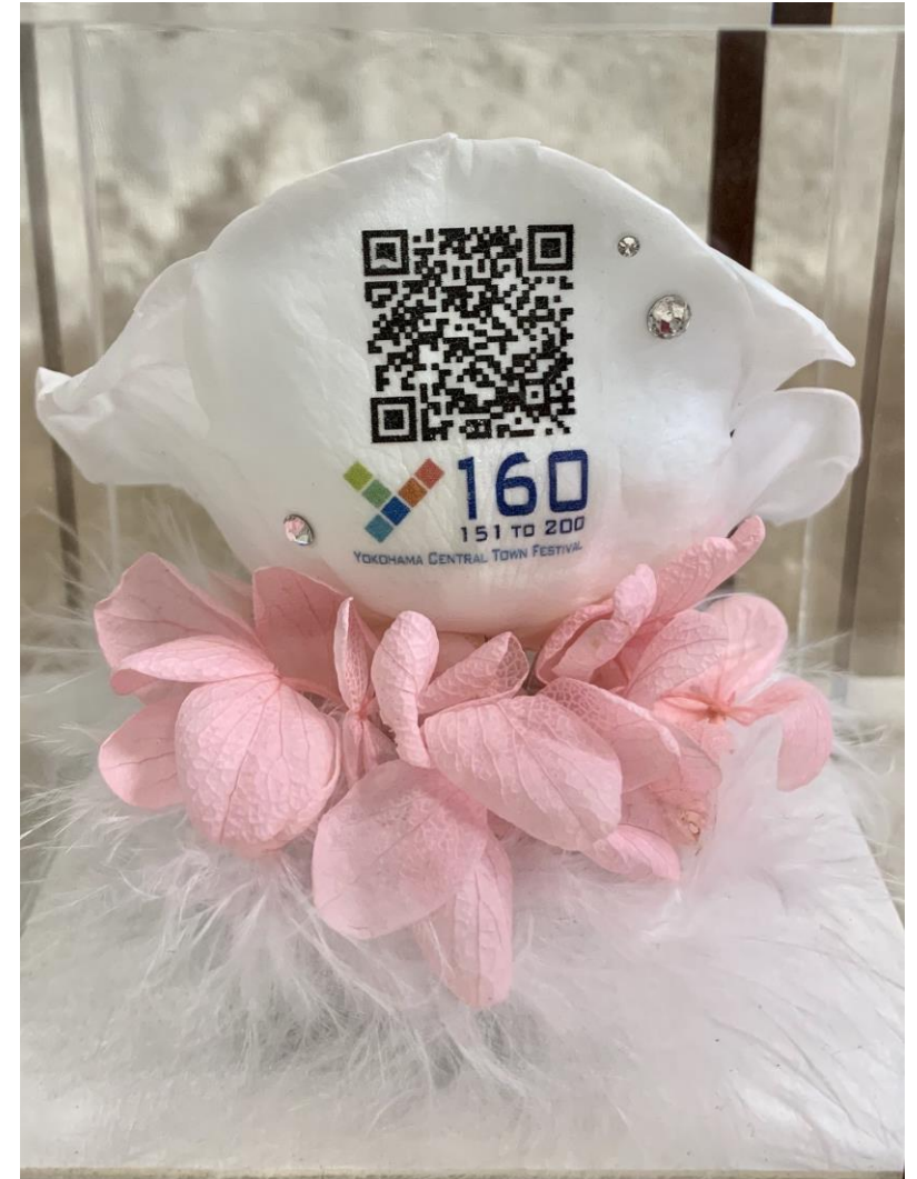
Y160 横浜開港160周年記念

在タイ日本国大使館にて開催の「天皇陛下誕生日レセプション」での来賓客 への贈呈花（ウエルカムフラワー）として採用いただいております。