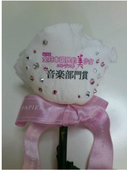
国民的美少女コンテスト