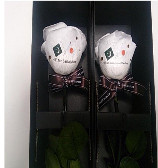
パキスタン外務省担当首相顧問