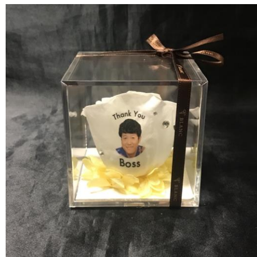
セカイマ（世界の旬・今を紹介する番組）