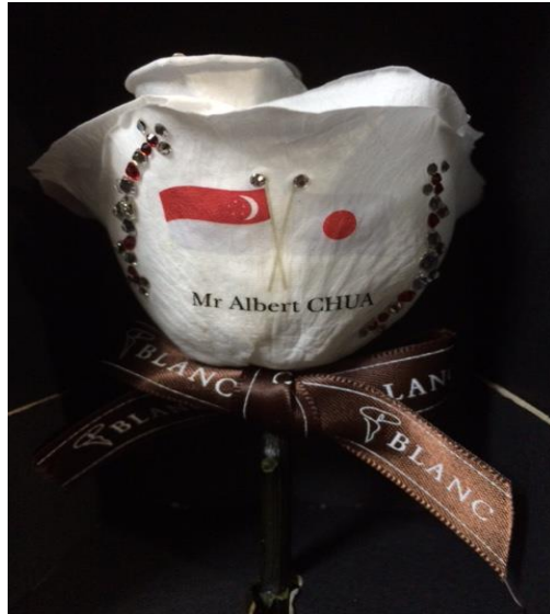
シンガポール常任委員