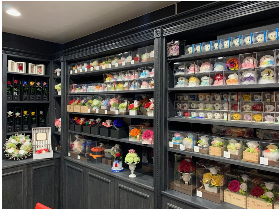
本社（東京都港区虎ノ門）