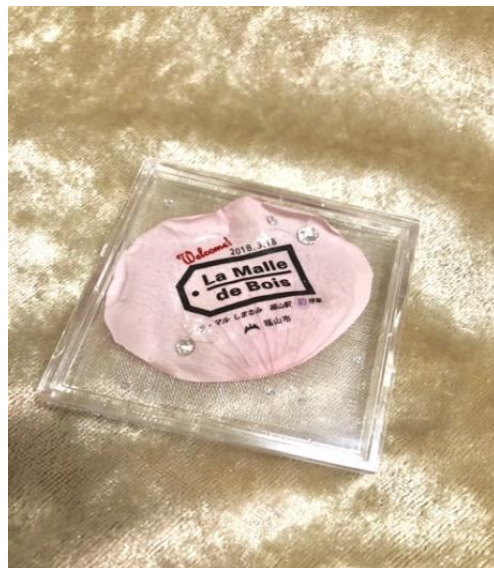
広島県福山市 観光列車停車記念 ラ・マルシマナミ