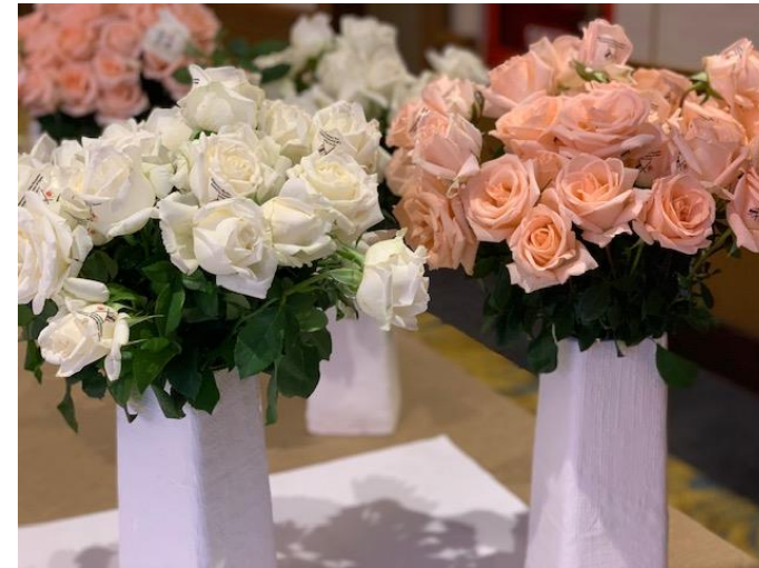
日タイ_メッセージフラワー