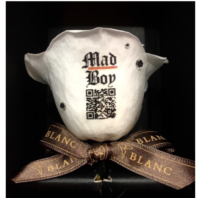
WBAライトフライ級スーパー王者 京口紘人選手 応援メッセージフラワー