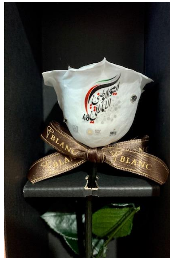
2019年 アラブ首長国連邦大使館 National Day