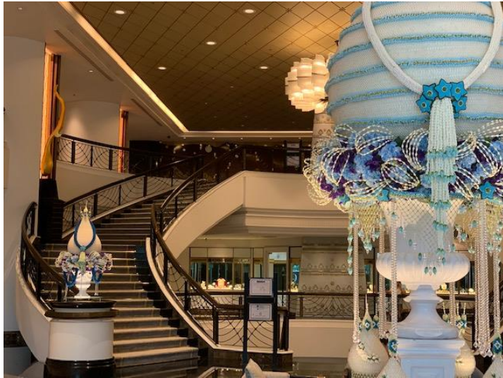
レセプション会場