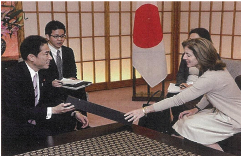
平成25年11月 ケネディ米国駐日大使へ 岸田外務大臣より贈呈