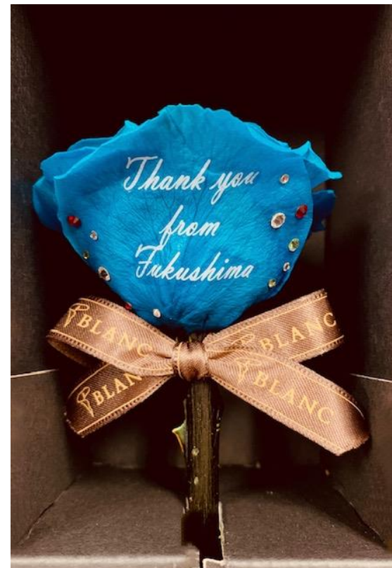
2019 福島県よりUAE大使 へ贈呈