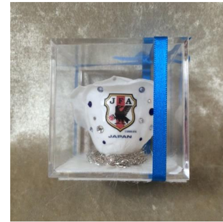
サッカー-日本代表