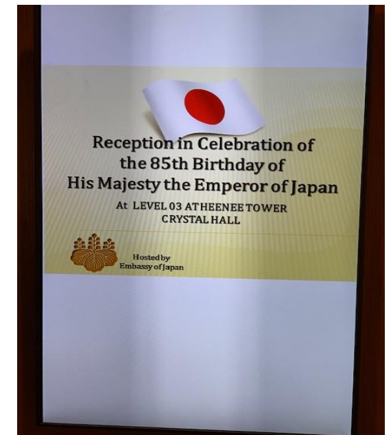
在タイ 日本大使館 主催