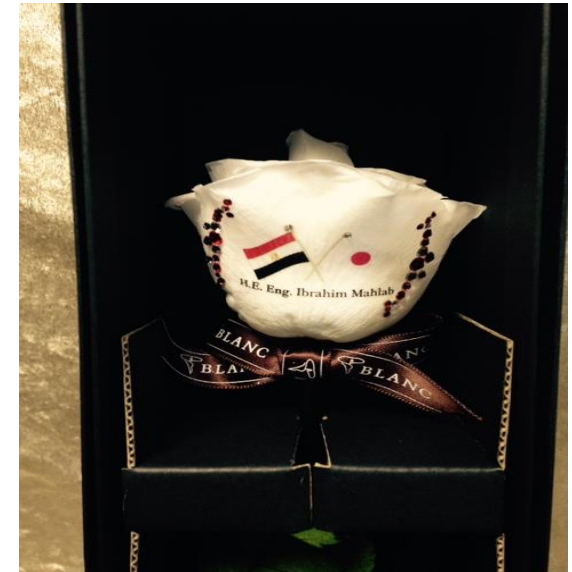
エジプト暫定首相