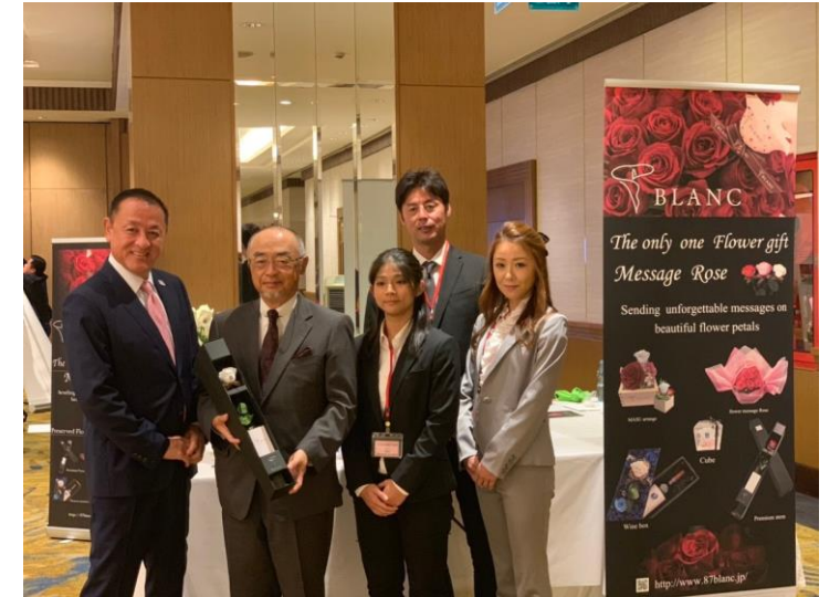
佐渡島駐タイ大使