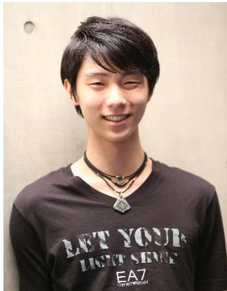
羽生結弦 Jewel Rose