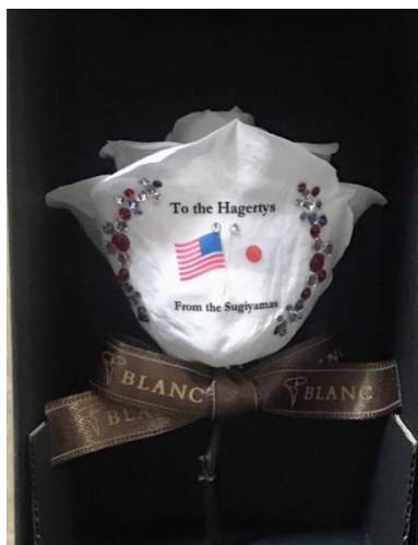
ハガティ駐日米国大使