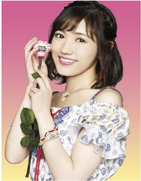
AKB総選挙上位7名贈呈