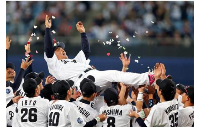
横浜DeNAベイスターズ様