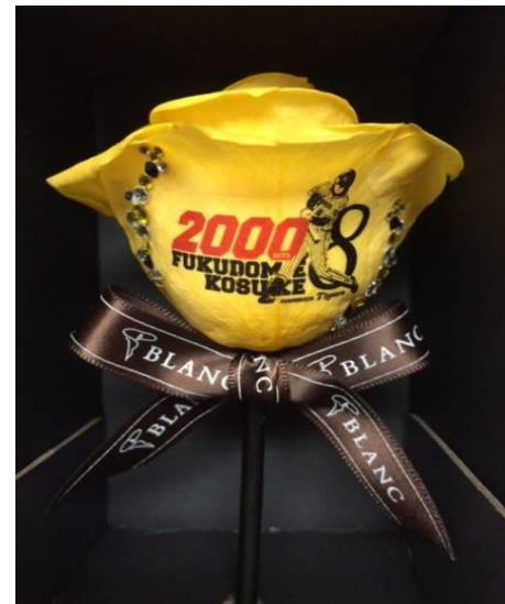
阪神タイガース福留選手 2000本安打達成記念