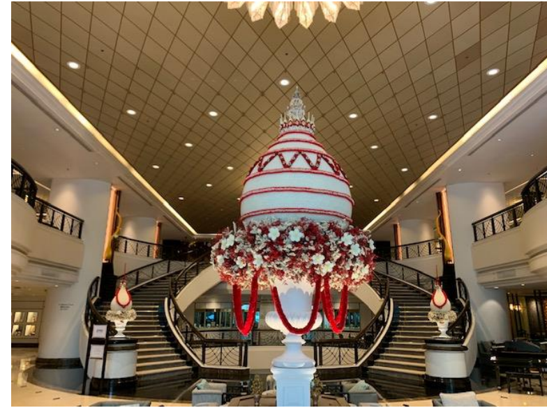
レセプション会場