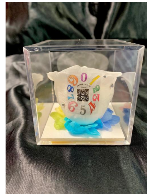
フランクミュラー