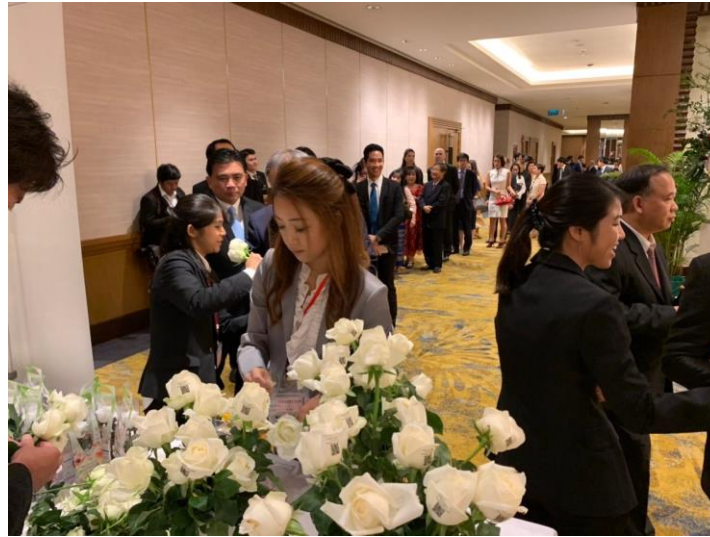
贈呈待ち(長蛇の列)