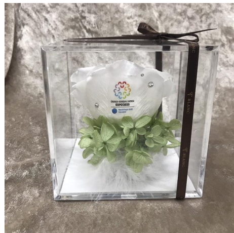
2025 大阪万国博覧会 誘致委員